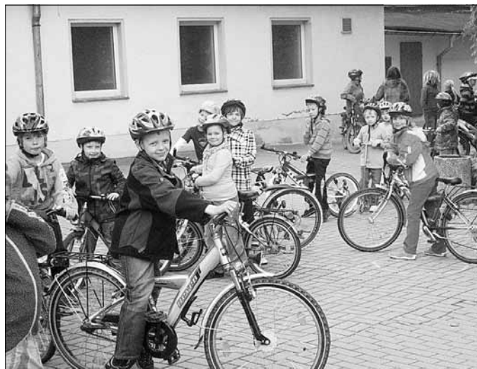
Schüler der 1. Klasse machen sich startklar