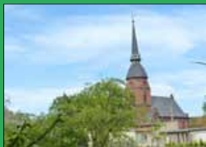
Unterwiederstedt - die älteste Kirche Anhalts