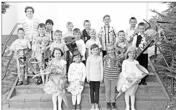
Grundschule Welbsleben: Klasse 1a mit ihrer Klassenlehrerin Frau Götzte

Gemeinsam mit ihren Eltern, Geschwistern und Großeltern erlebten sie dann ein Programm der älteren Grundschüler, in dem sie bei den ABC-Schützen Neugier auf das Kommende weckten.