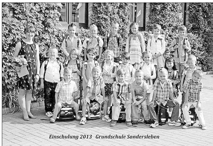
Einschulung 2013 Grundschule Sandersleben