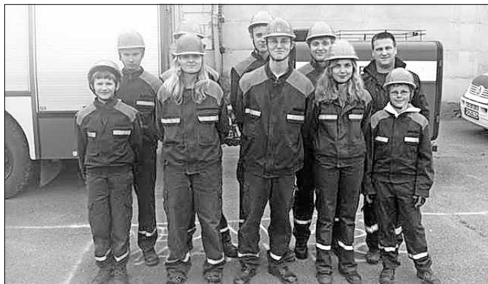
Sanderslebener Jugendfeuerwehrteam im Bundeswettbewerb