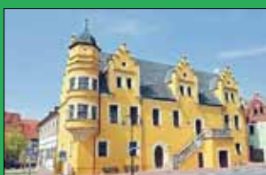
Rathaus Sandersleben (Anh.)