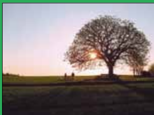
Einzelner Baum Sylda