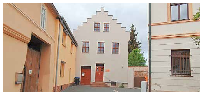
Blick zum Stadtmuseum in Sandersleben, das 25-jähriges Jubiläum begeht

Das Museum in Sandersleben wurde vor 25 Jahren im Jahre 1999 gegründet. Es erhielt den Namen Stadtmuseum „Altes Gerichtsgefängnis“. War doch das Gebäude einst als Gefängnishaus des ehemaligen Amtsgerichts Sandersleben, das sich gleich nebenan im heutigen Rathaus befand, 1865 erbaut und im gleichen Jahre eröffnet worden.